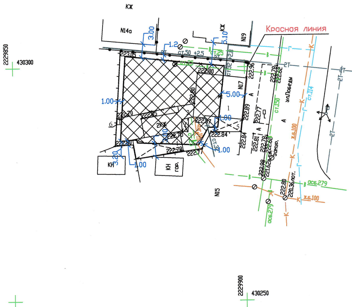
Схема размещения объекта капитального строительства М 1:500